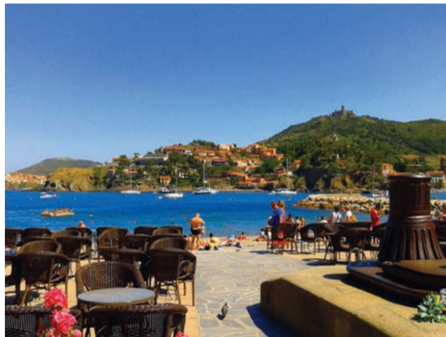
Les séjours d'été proposés par la Ville pour les 7-16 ans conjuguent découverte, activités et divertissements.

Chaque été, la Ville propose des séjours en juillet et en août pour les jeunes Ovillois âgés de 7 à 16 ans, qui bénéficient d'un programme d'animations riches et variées. Dans un environnement adapté, ces séjours conjuguent découverte, divertissements et loisirs, tout en s'attachant à répondre aux goûts et aux attentes des jeunes vacanciers. Les inscriptions aux séjours débutent dès le mois de mai avec au programme :