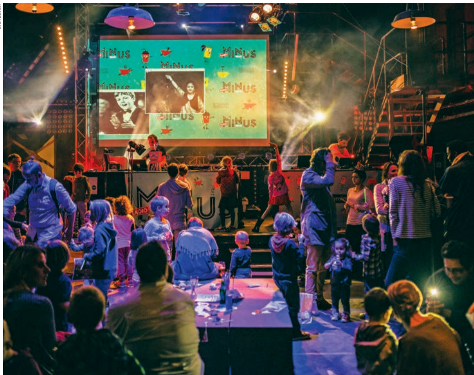
Le duo Gangpol & Mit propose une boum interactive dans un univers qui décoiffe !