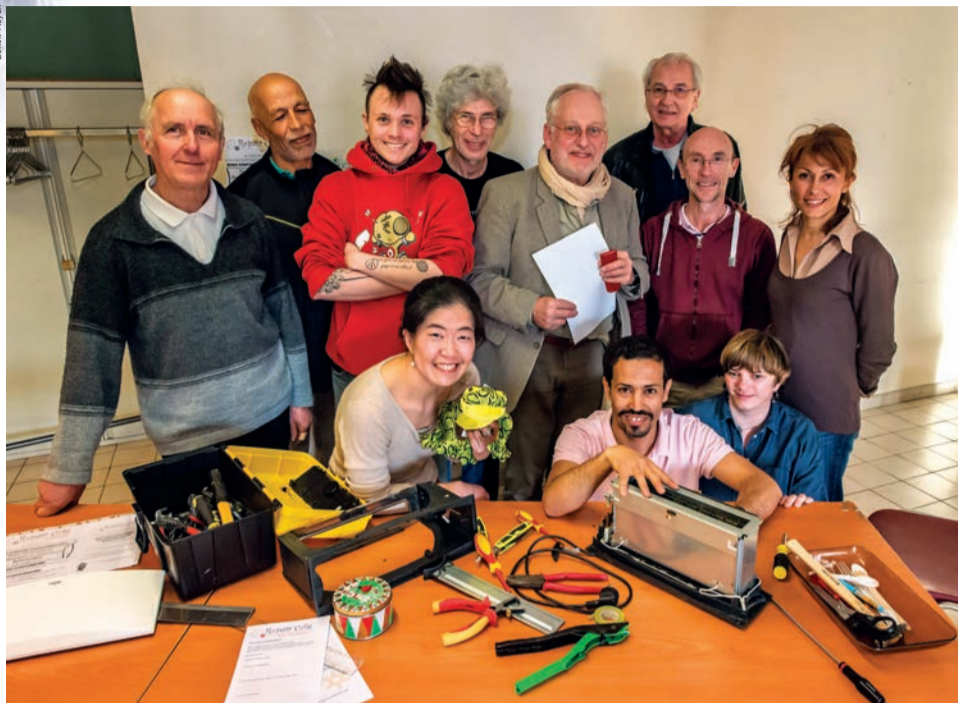
L'association Green'Houilles lance un atelier de réparation participatif.

É conomie circulaire, consommation responsable, développement durable et solidaire. Trois principes qui animent les actions de la toute jeune association Green'Houilles. Pour promouvoir auprès des Ovillois les valeurs qui lui tiennent à cœur, l'association lance un Repair Café, un atelier de réparation participatif. Le concept ? Réparer plutôt que jeter en donnant une seconde vie à des objets défectueux ou en panne (petit électroménager, vêtements, jouets...). Une renaissance possible grâce au concours des bénévoles de l'association, bricoleurs avertis, qui mettent leurs compétences (couture, électronique...) au service des visiteurs. Rendez-vous, le dimanche 22 mai, salle Michelet, où chacun pourra apporter des objets à remettre en état. « Le but n'est pas