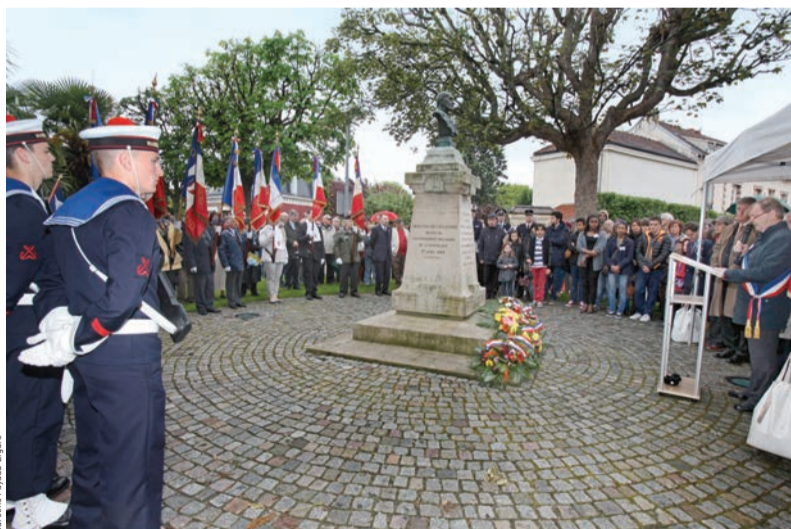
Cérémonie du souvenir en 2014, place Victor-Schœlcher.

Le 10 mai marque la Journée nationale du souvenir de l'abolition de l'esclavage. Pour les Yvelines, la ville de Houilles a été choisie pour accueillir la cérémonie commémorative départementale qui sera présidée par Serge Morvan, préfet des Yvelines, en présence du maire Alexandre Joly, des élus locaux et des autorités civiles et militaires. L'occasion d'honorer toutes les victimes de cette tragédie humaine. Mais