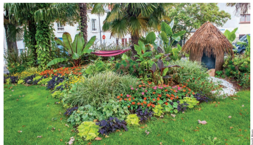
Fleurissement réalisé place Victor-Schœlcher lors des Trophées yvelinois 2015.

La Ville de Houilles participe aux Trophées yvelinois 2016 du fleurissement organisé par le conseil départemental des Yvelines. Notre ville, détentrice de deux fleurs, concourt cette fois-ci sur le thème « Les nouveaux fleurissements ». L'occasion pour les jardiniers municipaux de faire preuve d'innovation et de modernité. Durant l'été, les Ovillois pourront ainsi découvrir leurs réalisations mettant en