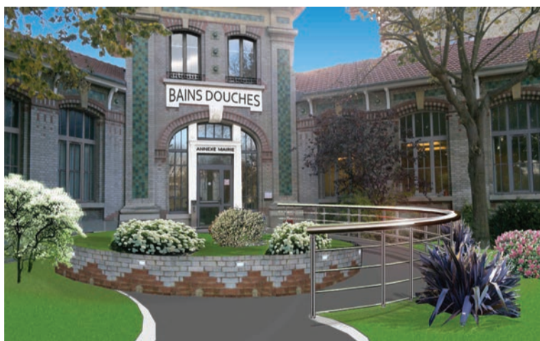
Projet de mise en accessibilité de l'annexe de la mairie, parc Charles-de-Gaulle.

grammés pour une durée de six mois, les nouveaux aménagements permettront d'accueillir différents services municipaux qui disposeront de locaux administratifs adaptés à leurs besoins et leur permettant de recevoir du public. Montant des travaux : 498 400 € TTC. ■