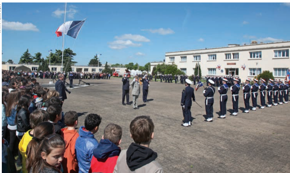
Près de 650 écoliers, collégiens et lycées sont accueillis au centre Commandant-Millé à l'occasion de la célébration du 8 mai 1945.

Il y a soixante et onze ans, le 7 mai 1945, l'acte de capitulation sans conditions de toutes les forces allemandes est signé à Reims. Mais la cessation des combats ne sera effective que le lendemain, le 8 mai. Afin de commémorer cette date événement qui signe la cessation des combats en Europe, le centre Commandant-Millé de la Marine nationale accueille, tous les deux ans, des élèves des établissements scolaires de Houilles et de Carrières-sur-Seine pour les associer au devoir de mémoire. Le 26 mai, ce sont donc près de 650 écoliers, collégiens et lycéens qui