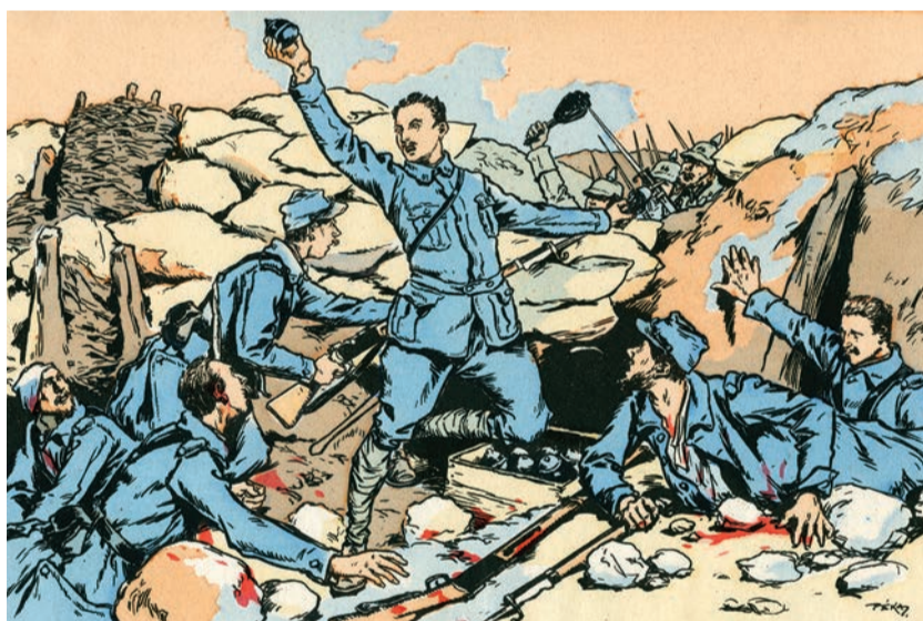
« Debout les morts !... », lithographie du dessinateur Paul Kaufmann dit Peka (musée de l'Image, Épinal).

Le 29 mai, la France et l'Allemagne commémorent le centenaire de la bataille de Verdun, l'une des batailles les plus meurtrières de la Grande Guerre.