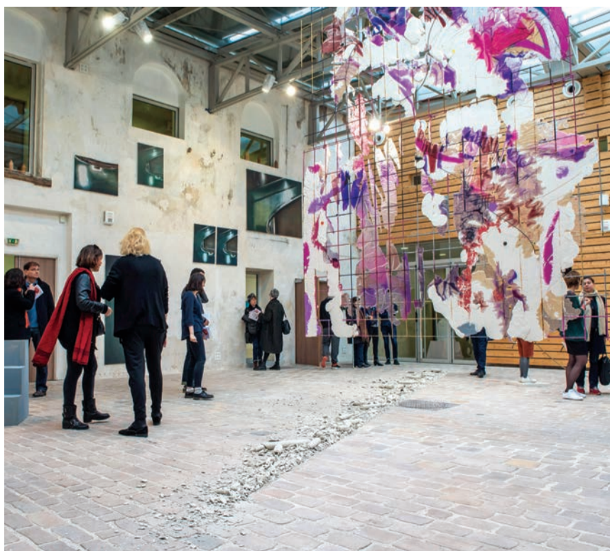
Les univers éclectiques de 11 artistes sont à découvrir à la Graineterie dans le cadre de la Biennale de la jeune création.

> Ateliers « Parlons d'art » : samedi 28 mai à 15 h 30. La Graineterie (27, rue Gabriel-Péri). Renseignements : 01 39 15 92 10 / lagraineterie.ville-houilles.fr