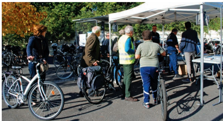
Opération gratuite de marquage de vélos.

La Ville organise plusieurs opérations gratuites de marquage de vélos dans différents secteurs de la commune, en collaboration avec le conseil général des Yvelines. L'opération consiste à graver sur le cadre du vélo un numéro unique et ineffaçable répertorié dans une base de données nationale gérée à partir de la plateforme Internet de la Fédération française des usagers de la bicyclette (Fubicy). Ce fichier national permet à chacun de savoir, à partir du numéro marqué, si un vélo a été déclaré volé. Le dispositif contribue ainsi à lutter contre le recel, à limiter les risques de revente illicite et à faciliter la restitution du vélo au propriétaire (40% des vélos