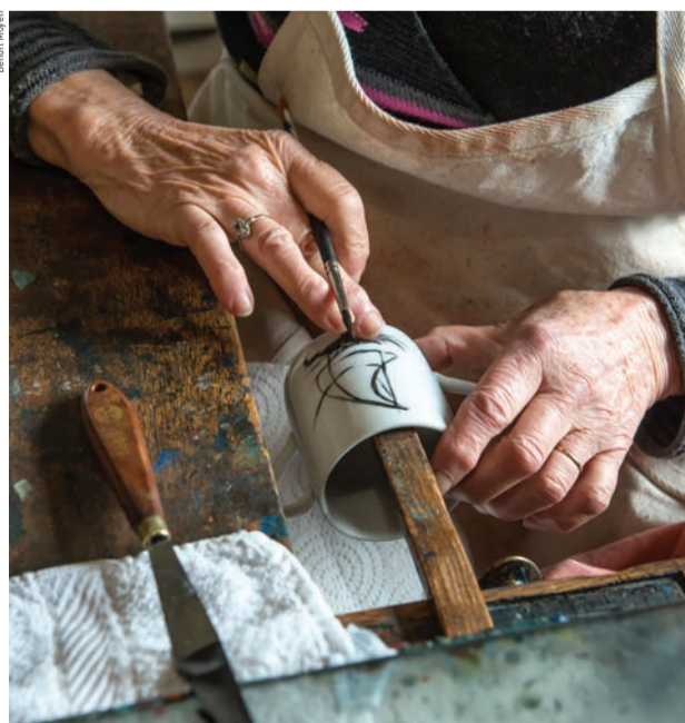
Vitrine de l'excellence, près de 300 métiers et spécialités composent la galaxie des métiers d'art.

Faire un travail concret et créatif, être autonome, acquérir une maîtrise technique et un savoir-faire reconnu, pouvoir s'installer à son propre compte... Des perspectives qui expliquent que de plus en plus de jeunes sont attirés par ces professions. Plus de