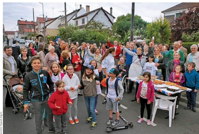
La Fête des voisins, un temps de rencontre et de partage apprécié de tous.

Fête des voisins : vendredi 27 mai à partir de 19h.